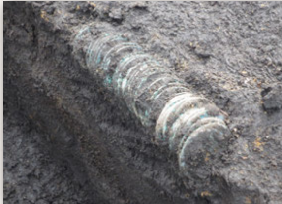
さし銭出土状況（濱田遺跡）

発掘調査を行っている、「埋蔵金は出てくるのか？」といった質問が寄せられますが、市内では残念ながら備蓄銭や金銀財宝の発見は未だありません。発掘調査で出土するお金の多くは、当時の人の遺失や宗教儀礼にともなったものなど、少額で少量のものがほとんどを占めています。平成24年度に調査を行った大隅町梶ヶ野の濱田遺跡では、47枚の銅銭がまとまった状態