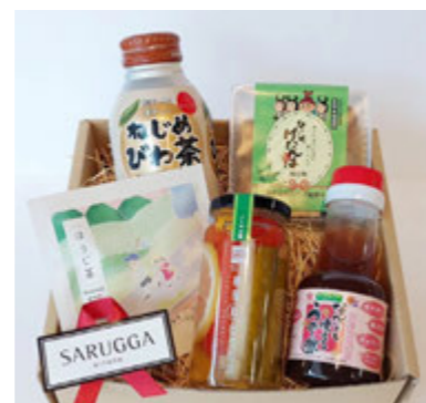
プレゼントのイメージ