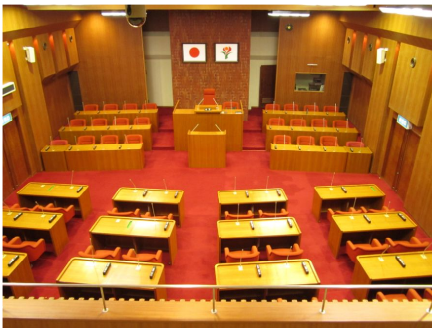
傍聴席から見た議事堂

議会では、広く市民の皆様へ情報を公開してあります。(ライブ中継・録画映像配信) 曾於市ホームページから議会中継をパソコンやスマートフォン、タブレット等で視聴できます。 ※アドレスは下記のとおりです。 (アドレス http://www.city.soo.kagoshima.jp/ )・・・曾於市ホームページ (アドレス http://www.soo-city.stream.jfit.co.jp/ )・・・議会中継