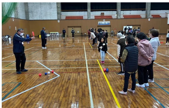
ニュースポーツ大会