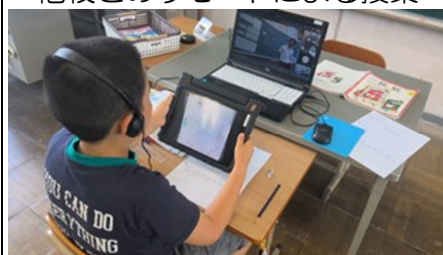
他校とのリモートによる授業

また、市内や市外の学校とのリモート授業のサポートや、小中学校で必修化された「プログラミング教育」を含めた、学校におけるICT教育の推進のための業務を行います。