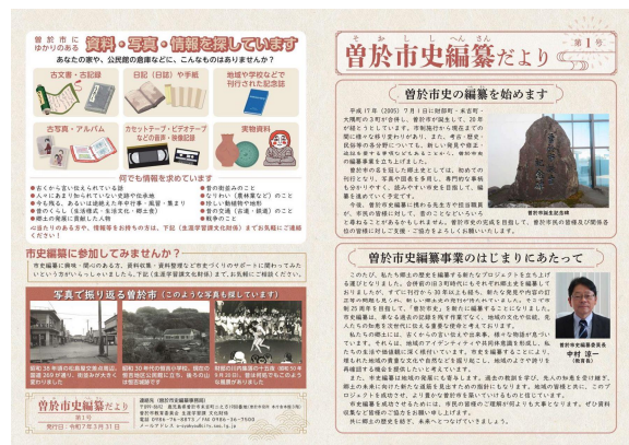
曾於市史編纂だより 第1号 (表紙)