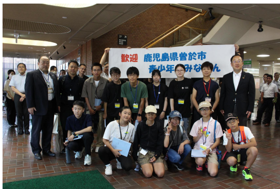
鶴岡市・曾於市友好都市間青少年交流事業