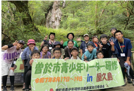
青少年リーダー研修

校区・地区公民館の活性化を図り、明るく住みよい地域づくりを推進することを目的に運営補助金を交付します。