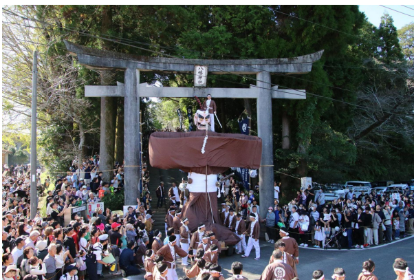
国重要無形民俗文化財『岩川の弥五郎人形行事』 (令和7年3月28日指定)