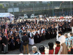
奉納武道大会開会式