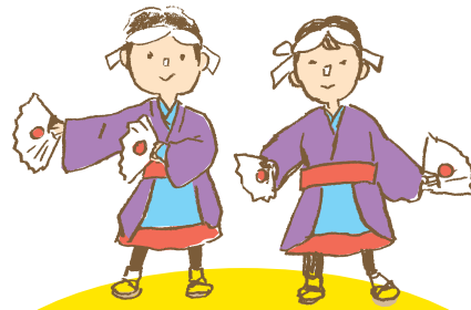
まいとし ちか にちようび 毎年4月8日に近い日曜日 みぞの くらどう やっこおど 溝ノ口洞けつの奴踊り