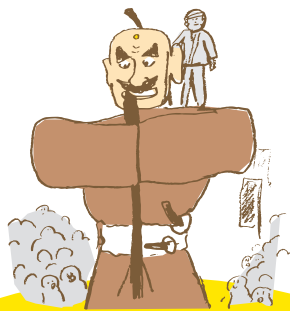
まいとし 毎年 11月3日 いわがわ はちまん じんじゃ や ごろう まつ 岩川八幡神社の弥五郎どん祭り