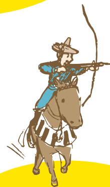
まいとし 毎年 11月23日 すみよし じんじゃ やぶさめ 住吉神社の流鏝馬