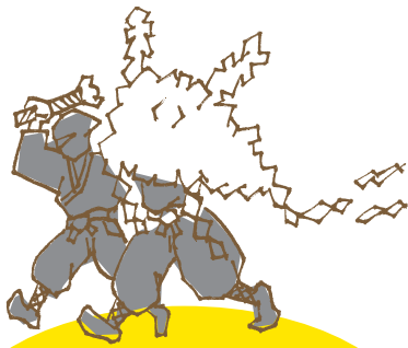
まいとし 毎年 1月7日 くまの じんじゃ おにお 熊野神社の鬼追い

そお市のこと、もっともっと学んで、 どんどん好きになって、「そお学」を深めてください。