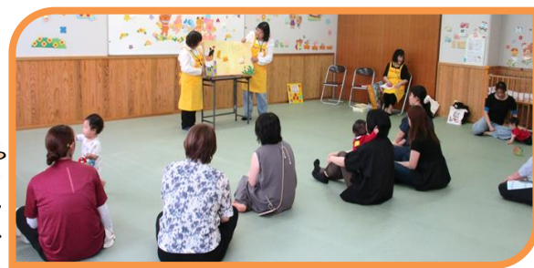
《 ちゃいはなさんと触れあおう 》