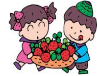
《ひろば：はじめまして》