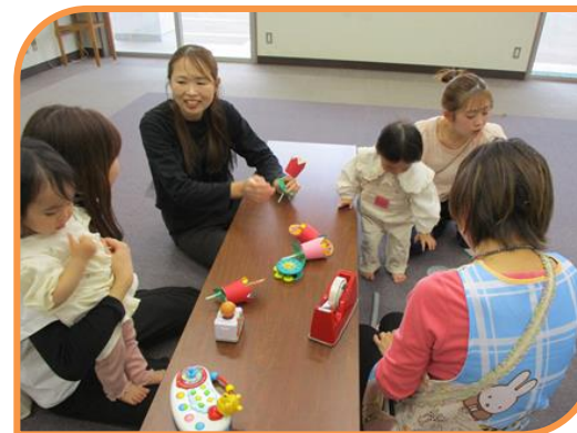
《ひろば：はじめまして》