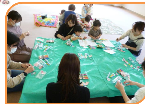
《ひろば：ゆらゆらこいのぼり》