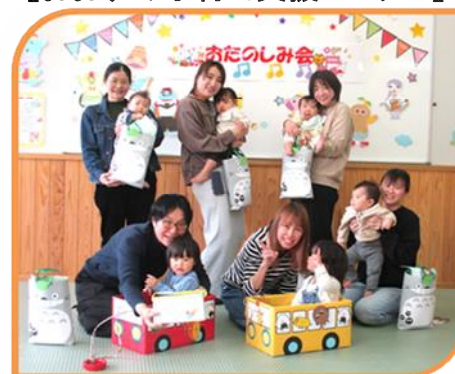
《ひろば：お楽しみ会》

キッズルーム開放の時間は、ゆっくりお子さまとの時間を過ごせる自由あそびとなっています。