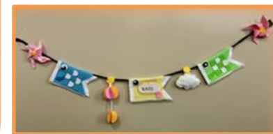
《ひろば：ふわふわこいのぼり》