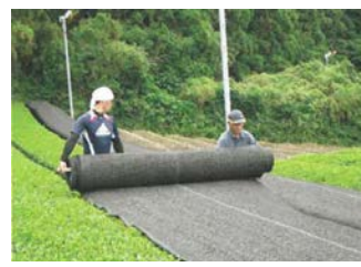
茶の被覆作業の実施