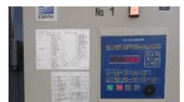
環境制御盤の導入