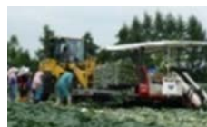
機械化体系の導入